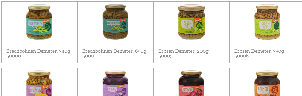
Brechbohnen Demeter, 340g 50000